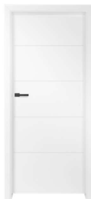
BALDUR 6 580,00 zł* / 713,40 zł**