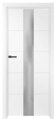
BALDUR 5 990,00 zł* / 1217,70 zł**